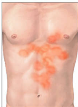
تینه آ کورپوریس (کرم حلقوی)

علائم عفونت قارچی می‌توانند شبیه سایر عارضه‌های باشد. در چنین مواردی همیشه برای تشخیص به پزشک مراجعه کنید.