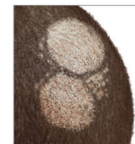
تینه آ کاپیتیس (کرم حلقوی پوست سر)

گاهی اوقات عفونت قارچی پوست سر به کریون تبدیل می‌شود که یک ضایعه دردناک بزرگ است که در محل عفونت قارچی اولیه ایجاد می‌شود. این وضعیت می‌تواند به دلیل حساسیت بیش از حد عفونت قارچی بروز کرده و باعث ایجاد راش در جاهای دیگر بدن و دردناک شدن گره‌های لنفاوی گردن شود.