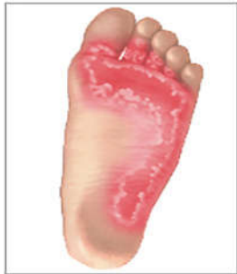
تینه‌آ پدیس (پای ورزشکاران)

عفونت قارچی کشاله ران (تینه‌آ کروریس). (گاهی اوقات درمان عفونت قارچی مشکل است. این عارضه نیز بیشتر در میان مردان شایع بوده و اغلب در هوای گرم بروز می‌کند. عفونت قارچی کشاله ران به ندرت در زنان بروز می‌کند. علائم عفونت کشاله ران عبارتند از: